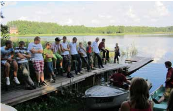
Pavadot laiku ar Freimaņu skolas skolniekiem Latgalē, mēģinot iejusties Dziesmu svētku koru dalībnieku lomās Mežaparka Lielajā estrādē

karavīri, kas sargā kritušos karavīrus. Es domāju, ka ir ļoti bēdīgi redzēt, cik daudz latviešu krita karā, bet bija arī labi redzēt Brāļu kapus, lai mēs varam atcerēties, ka viņi cīnījās, lai Latvija varētu būt brīva valsts.