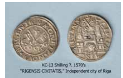
Independent City of Riga, 1570 Shilling and Livonian Knights, 1400 Reval (left)