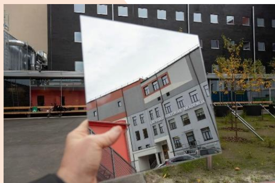
Kultūras akadēmijas jaunās mājas – Tabakas fabrikā, Miera ielā 58a