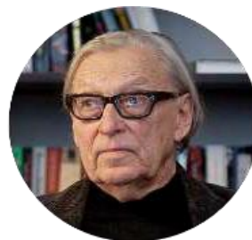
Gunārs Birkerts (1925-2017) Bibliotēkas jaunā ēkas projekta autors, ievērojamais latviešu izcelsmes ASV arhitekts