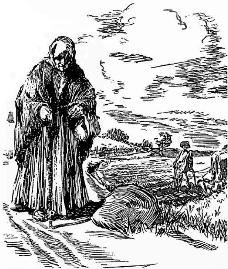
O. Norītis - ilustrācija J. Poruka stāstam Kukažiņa.