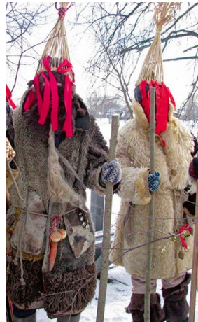
6. Budēļu vīri