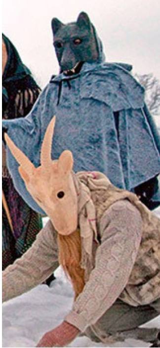
7. Vilks un kaza