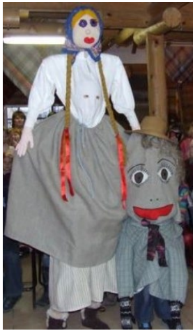
1. Gaŗā sieva un Mazais vīriņš